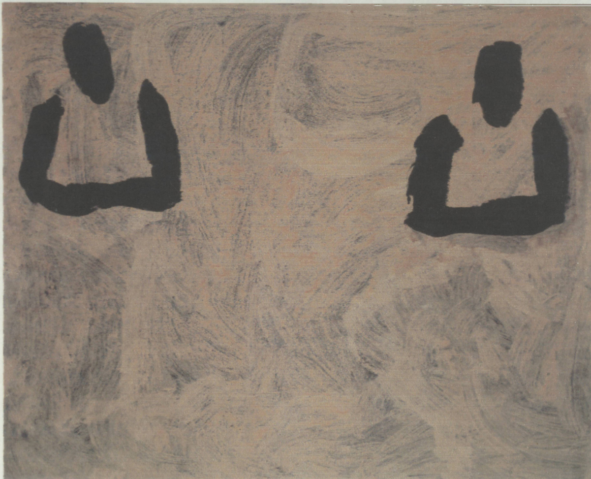
Leonel González "La Francia" 1991 Acrílico Sobre Tela 180 Cm x 230 Cm

El color de la ropa y del fondo se desvaneció, por el contrario el color de las figuras se afirmó. En las figuras ya no existen rasgos ni volumen. El tiempo los borró.