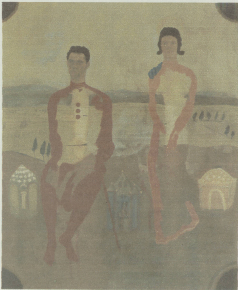
Leonel González "Felipe v de Borbón e Isabel Farnese." 1994 Acrílico sobre tela Medidas 2.00 x 1.61 m

Los colores del vestuario se desprendieron y se desvanecieron. Por ejemplo, en la figura masculina, sólo quedaron secuelas de lo que fueron unos botones del traje.