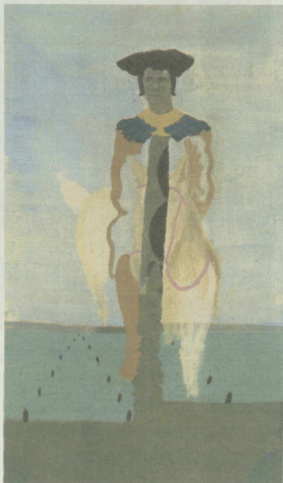
Leonel González “Caballero de Andalgalá” 1994 Acrílico Sobre Tela 169 cm x 100 cm

Surgió en el centro de la obra una línea verde con una imagen.