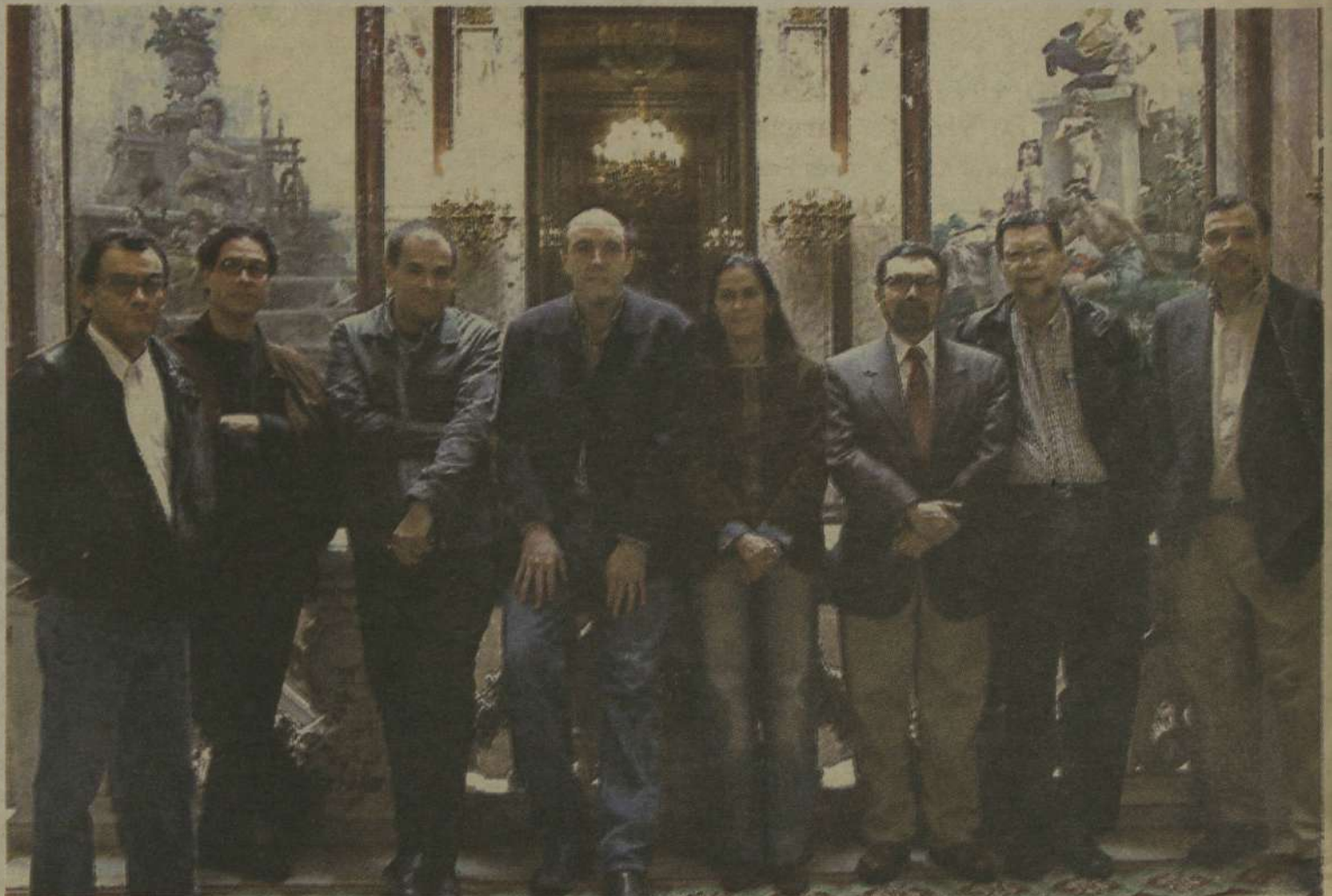
LA CASA DE AMÉRICA / PARA LA NACIÓN

A juicio de algunos de los participantes, no es posible abarcar dicho concepto más que de una manera estrictamente geográfica. Para Rodrigo Rey Rosa, "el concepto de literatura centroamericana existe porque se planteó desde fuera de la región y nosotros lo hemos adoptado así", subrayando que eso no